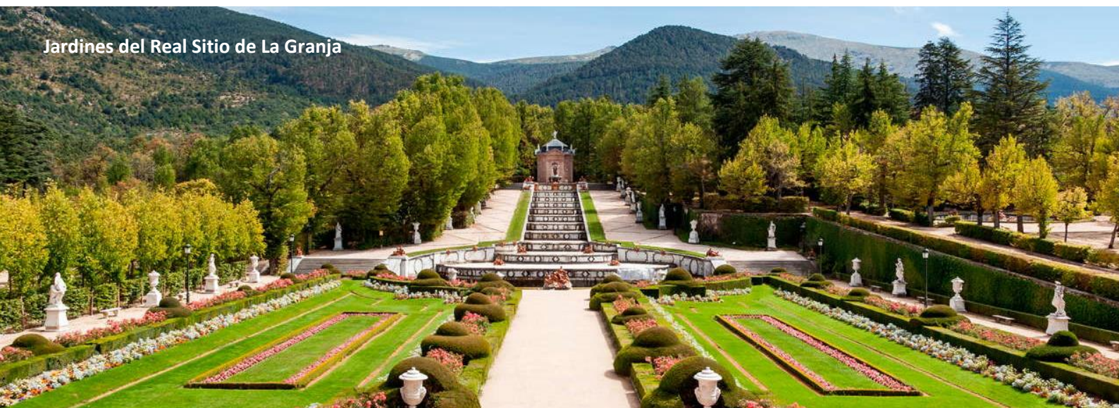
Jardines del Real Sitio de La Granja