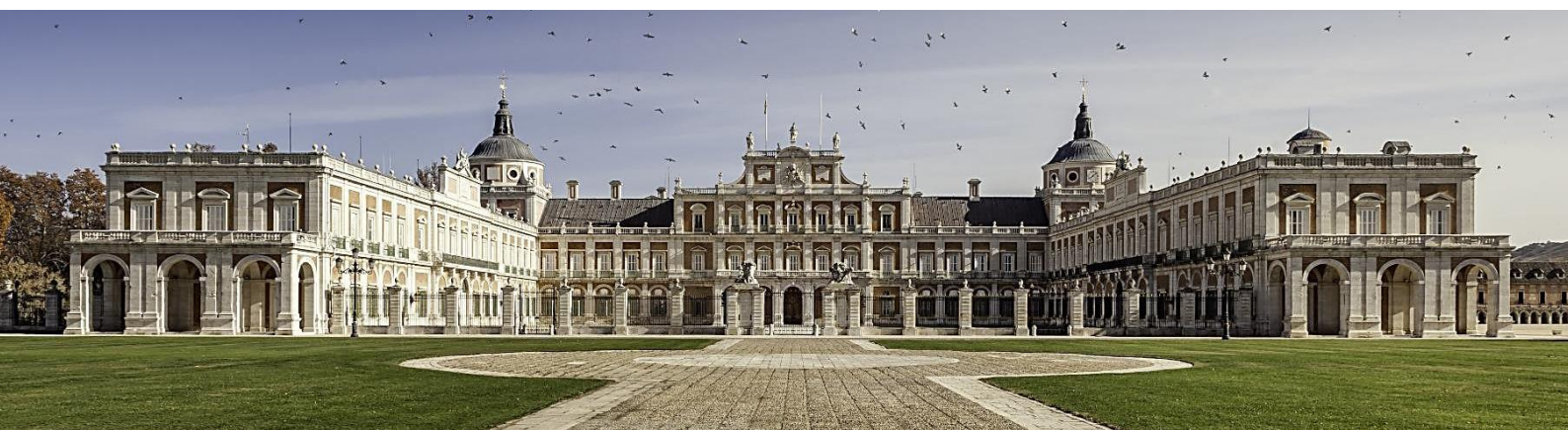
Fachada principal del Real Sitio de Aranjuez

En este año, tres siglos después, recordamos el tercer centenario de una visita , y de un libro, que hacen época para los Sitios Reales: la embajada extraordinaria del duque de Saint-Simon , enviado por Luis XV a Madrid. Sus famosas Memorias constituyen la mejor descripción de la vida en Versalles; pero también lo son de la corte y los palacios de Felipe V. Una nueva mirada a los Sitios Reales en ese punto decisivo: la transformación de las residencias y cazaderos de los Austrias en función de los gustos y necesidades de los Borbones.