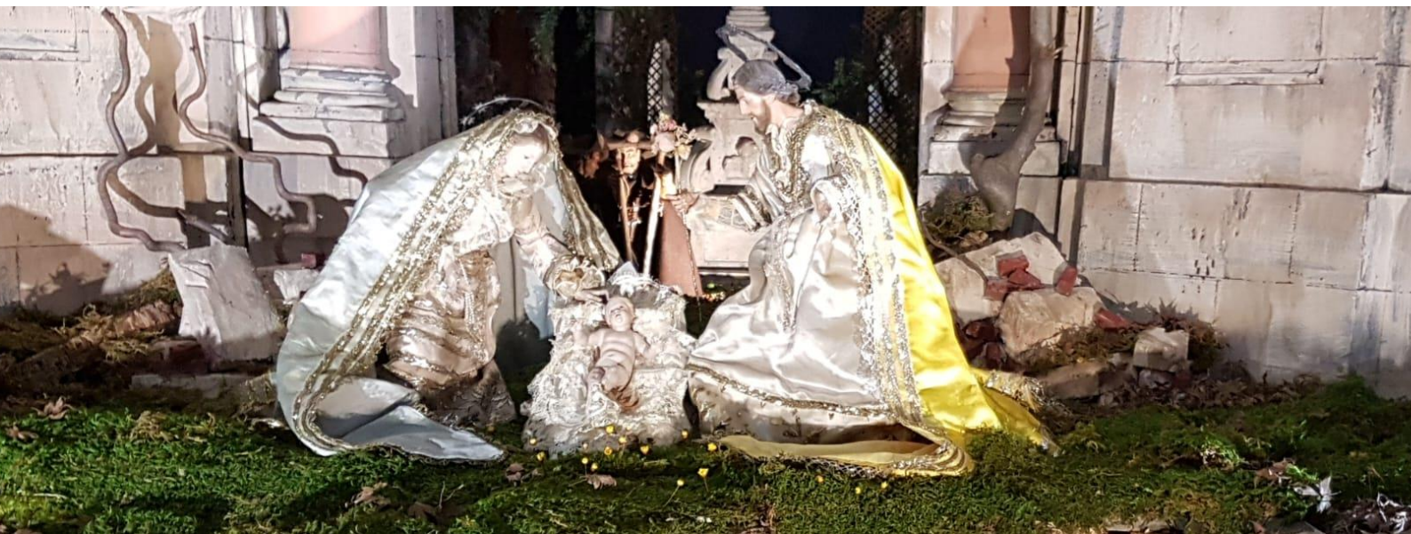
Belén napolitano en el Palacio Real de Madrid