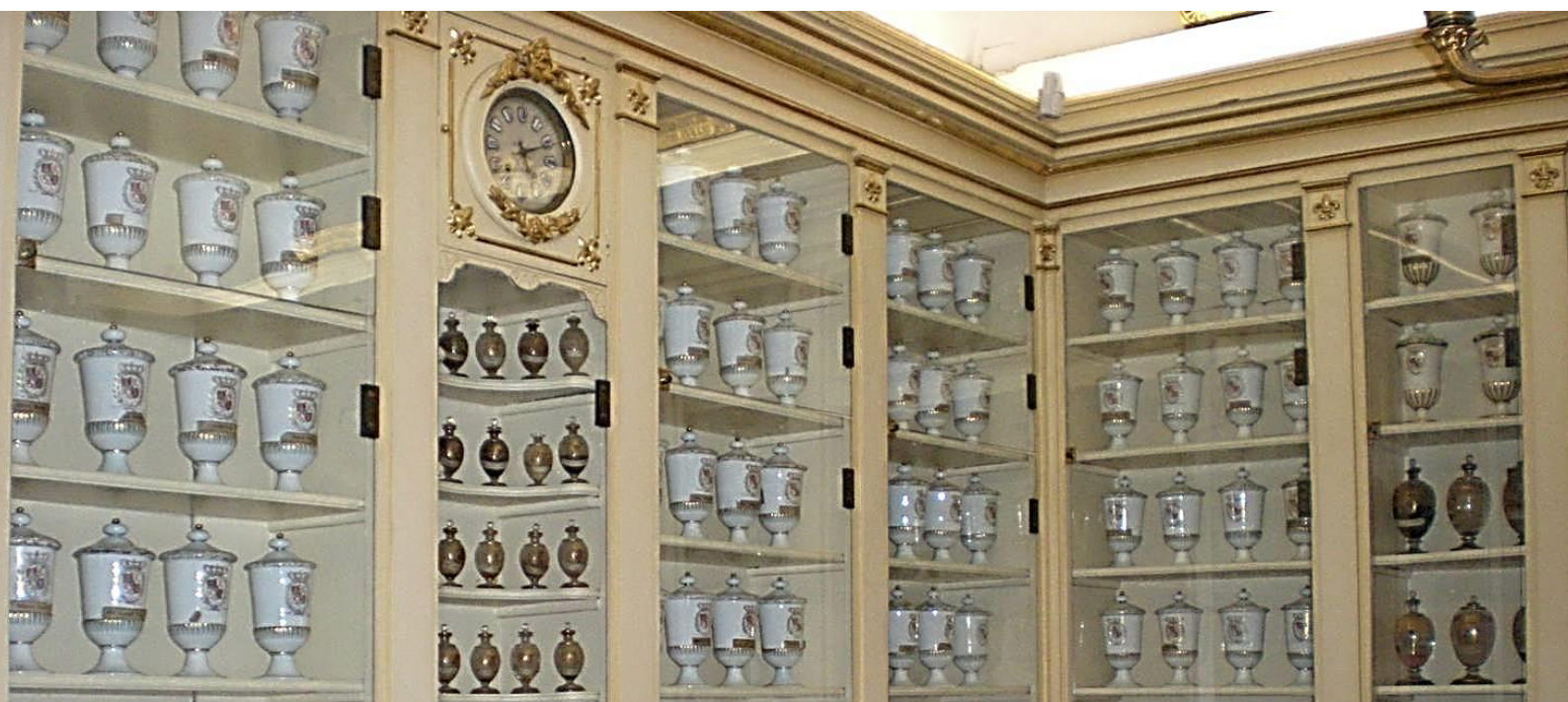
Real Botica del Palacio Real de Madrid

Dentro de las extensas colecciones de Patrimonio Nacional, destacan algunas que por su singularidad y enorme valor resultan enormemente atractivas. Poner en valor obras de arte extrañas en otros museos y en muchos casos únicas en España e incluso alguna de ellas, excepcionales en el ámbito internacional, es el propósito de este pequeño ciclo.