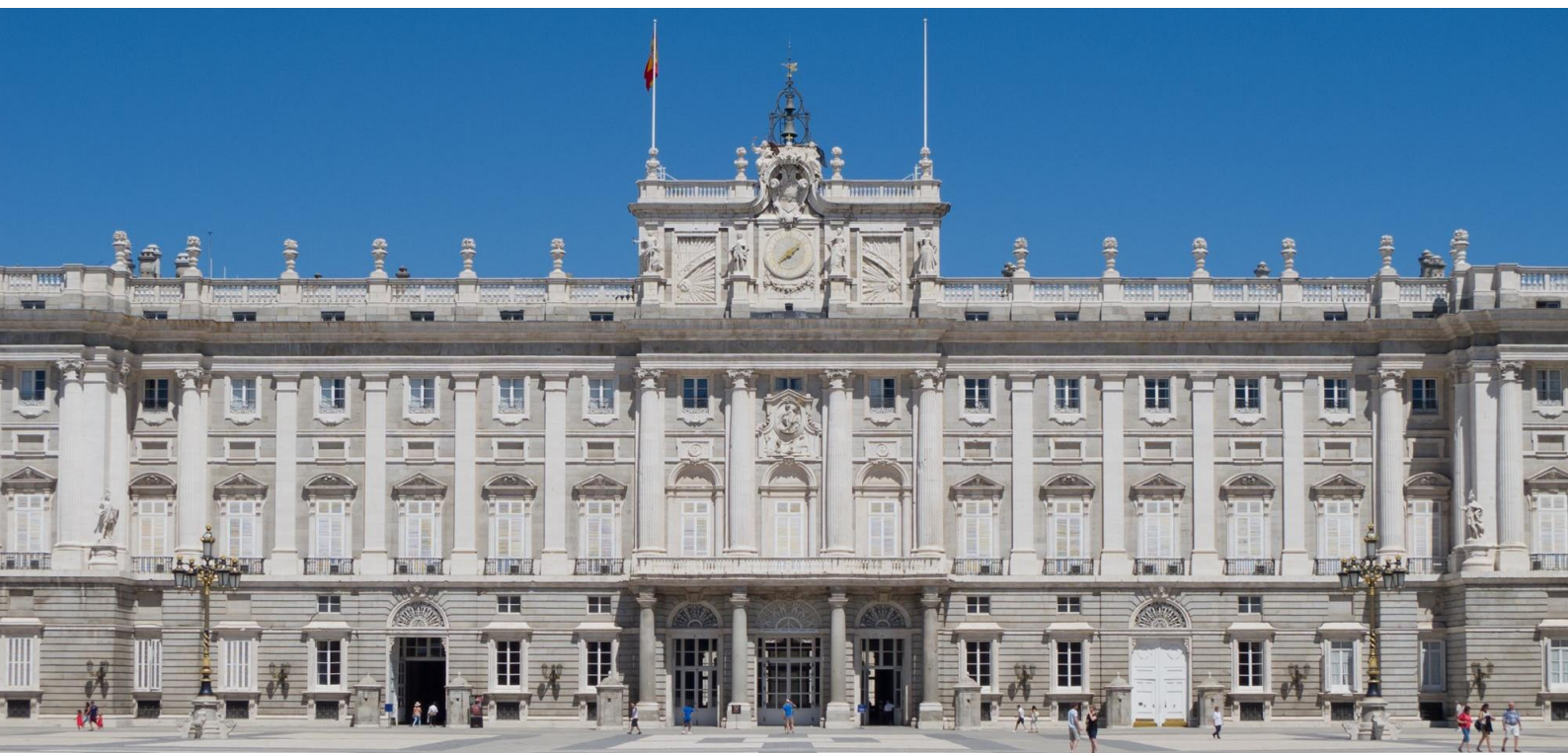
Fachada del Palacio Real de Madrid