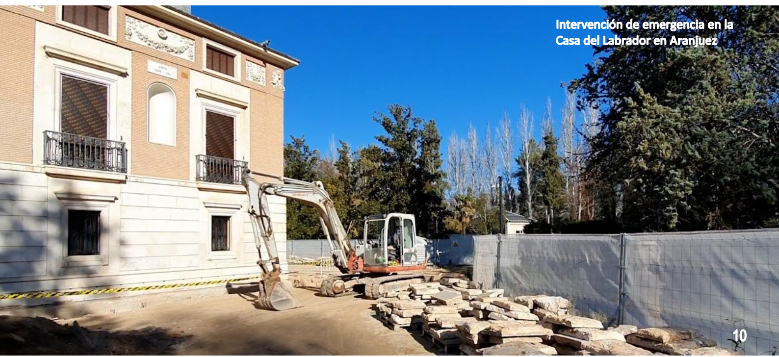
Intervención de emergencia en la Casa del Labrador en Aranjuez